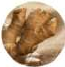
생강오일 ginger oil