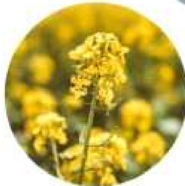
유채씨오일 rapeseed oil