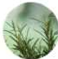
티트리오일 tea tree oil

11가지의 천연 오일을 블렌딩하여 만든 제품으로 피부에 부드럽게 스며들어 자극 없이 사용할 수 있습니다.